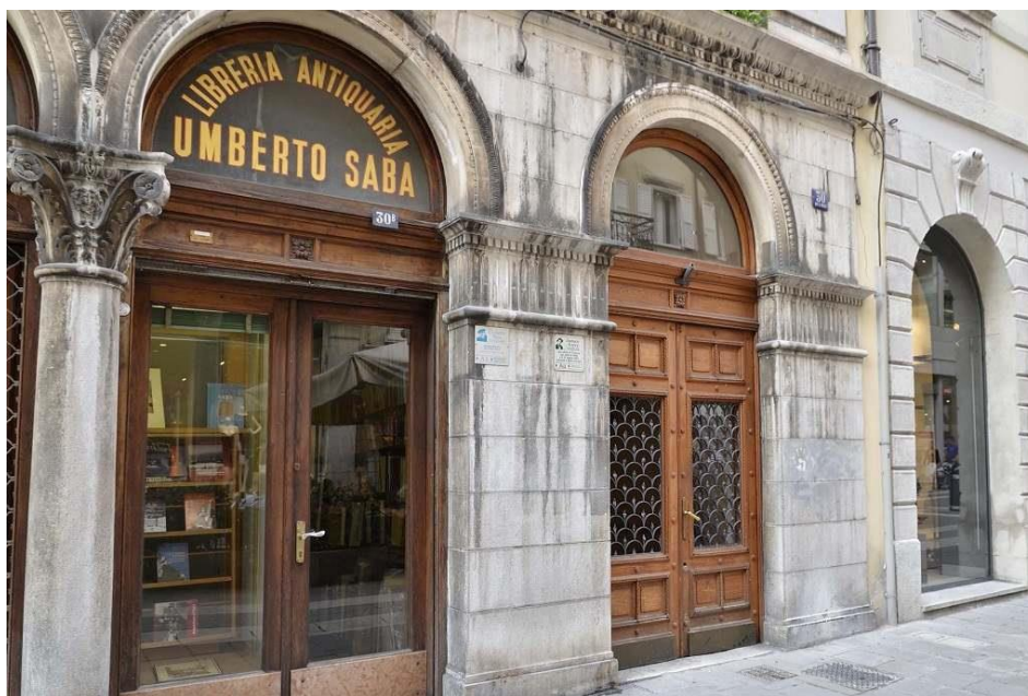
La Libreria Antiquaria Umberto Saba di Trieste, l'ingresso

Si è svolto mercoledì 25 settembre 2024 a Trieste l'appuntamento dei Commandeurs della Regione Friuli Venezia Giulia dei CICBF che si sono incontrati in Via San Nicolò 30 per visionare, in esclusiva anteprima, lo stato del restauro della Libreria Antiquaria Umberto Saba che sarà riconsegnata entro il mese di ottobre alla fruizione del pubblico. La scelta di questo particolare appuntamento per i CICBF si inserisce di diritto nell'adesione a un indirizzo culturale a noi molto caro e riconducibile ad un bisogno di memoria e di identità insieme, che caratterizza il nostro territorio e la città di Trieste tra passato e presente.